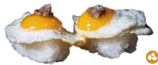
10. NIGIRI DE HUEVO DE CODORNIZ (Nigiri de huevo de codorniz con trufa) 5,00€