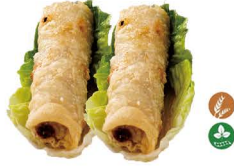
54. ROLLO DE POLLO (2 UDS.) (Crepes de arroz relleno de pollo y verduras ) 4,50€