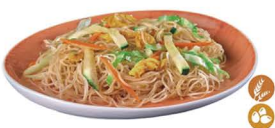
78. FIDEOS DE ARROZ YASAI (Con verduras y huevo) 6,00€