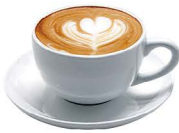
DESCAFEINADO CON LECHE 2,00€