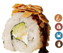
31. ROLL ALMENDRAS (Aguacate, queso y almendras) 6,00€