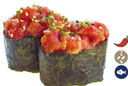
41. SPICY TUNA (Spicy tuna) 7,00€/ 2uds.