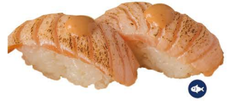
6. NIGIRI SALMÓN FLAMBEADO 4,50€