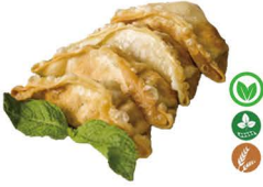
53. GYOZAS FRITAS DE VERDURA (4 UDS.) 5,50€