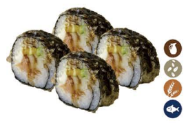
16. MAKI TEMPURIZADO (Maki frito en tempura relleno de salmón, escolar negro, aguacate, crema de queso y con salsa de anguila) 5,50€