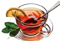
TÉ ROJO 2,20€