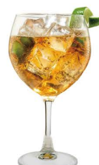
COPA DE LICOR ESPECIAL 5,00€