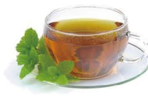
POLEO MENTA 2,20€