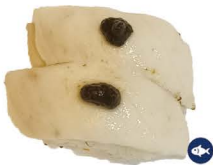
7. NIGIRI PEZ MANTEQUILLA FLAMBEADO 4,50€