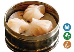
74. XIAO JAO GAMBAS (3 UDS.) 6,50€