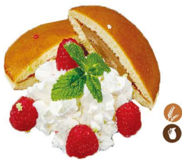
112. DORAYAKI CHOCO 6,00€