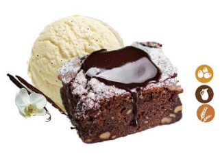
114. TARTA DE BROWNIE CON HELADO 6,00€