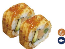
18. ROLL TEMPURIZADO (Tempura salmón y salsa teriyaki) 5,50€