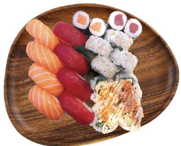
BANDEJA 2 (20 piezas)