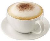
CAFÉ CAPPUCCINO 2,80€