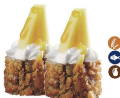
20. MANGOMAKI (Salmón, philadelphia, mango y salsa de mango) 5,00€