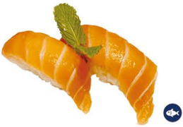
1. NIGIRI SALMÓN 4,00€