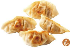
69. GYOZAS A LA PLANCHA (4UDS.) (Pollo y verduras) 5,50€