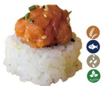
28. ROLL DE TARTAR DE SALMÓN (Roll de aguacate y salmón con salsa ponzu y sésamo) 6,00€