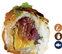
32. ROLL ATÚN GRATINADO (Aguacate, atún queso, y tobiko) 6,50€