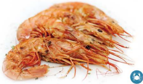
70. GAMBÓN A LA PLANCHA (4UDS.) 7,00€