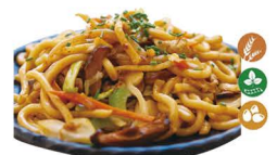
83. YAKI UDON (Con tallarines udon, setas, huevo, verduras, cebollino, soja y salsa tonkatsu.) 6,00€