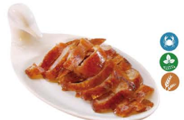
68. PATO ASADO (Pato asado) 9,50€