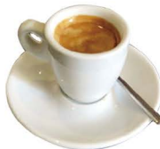
DESCAFEINADO SOLO 2,00€