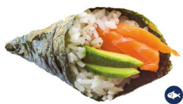
36. TEMAKI SALMÓN (Salmón y aguacate) 5,50€/ 1ud.