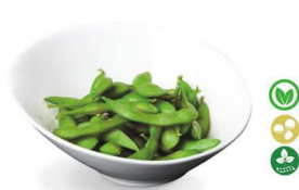
46. EDAMAMES 6,00€