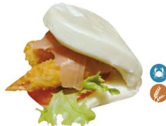
76. GUABAO GAMBAS (Bao de gambas) 7,00€/ 1ud.