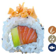
22. ROLL SALMÓN (Philadelphia, aguacate, cebolla frita y sésamo) 6,00€