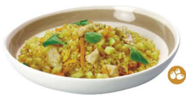
79. YAKIMEISHI CURRY TORI (Arroz con pollo, verduras salsa de curry y huevo) 8,00€