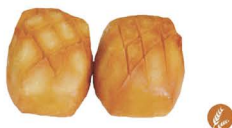
48. PAN CHINO 3,00€