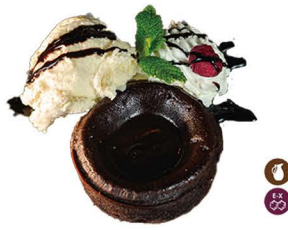
113. COULANT DE CHOCOLATE 6,00€