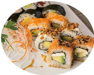
BANDEJA 1 (14 piezas)