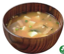
44. SOPA DE MISO 5,50€