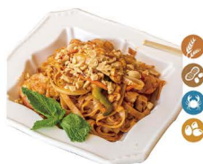
82. PAD THAI (Pad Thai, con pollo, langostinos, huevos, verduras, fideos de arroz y cacahuetes.) 8,00€