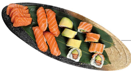
BANDEJA 3 (16 piezas)