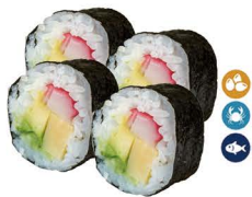
17. FUTOMAKI (Surimi, aguacate, huevo y pepino) 5,00€