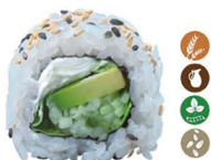
23. ROLL VERDURAS (Mixtas, philadelphia sésamo) 5,00€