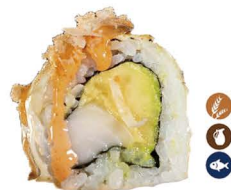
33. ROLL PEZ MANTEQUILLA GRATINADO (Aguacate, pez mantequilla queso, y tempura) 6,50€