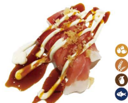
8. NIGIRI JAMÓN (Jamón y mayonesa) 4,50€