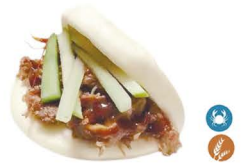
77. GUABAO PATO (Bao de pato) 7,00€/ 1ud.