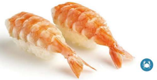
3. NIGIRI EBI 4,50€