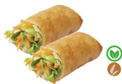
49. ROLLITOS VEGETALES (4UDS.) 5,00€