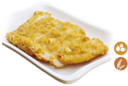
66. POLLO AL LIMÓN (Pollo con salsa de limón) 8,00€