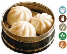
75. XIAO LONG BAO CARNE (3 UDS.) 6,00€