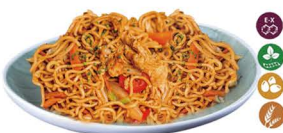
81. PAODAN MIAN TALLARINES (Paodan mian tallarines, con huevo, verduras y soja.) 6,00€