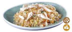
80. YAKIMEISHI TORI (Arroz con pollo, verduras y huevo) 8,00€