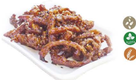
67. POLLO CARAMELIZADO (Pollo caramelizado con soja.) 9,00€