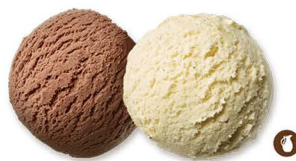
116. HELADO DOS BOLAS 5,00€