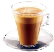
DESCAFEINADO CORTADO 2,00€