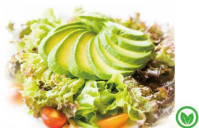
47. ENSALADA GOURMET CON AGUACATE 7,00€