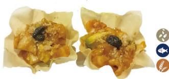
35. TACO DE PEZ MANTEQUILLA 6,00€/ 2uds.