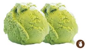
117. HELADO DOS BOLAS TÉ VERDE 5,50€