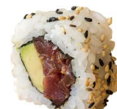
30. ROLL SPICY TUNA (Aguacate, atún kimuch) 6,50€