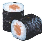
13. MAKI SALMÓN 3,50€