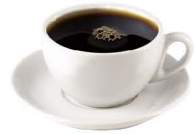
CAFÉ AMERICANO 2,00€