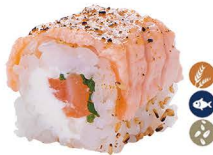
29. ROLL ABURI (Aguacate, salmón con salsa anguila) 6,00€