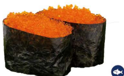
40. TOBIKO 6,00€/ 2uds.