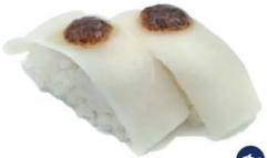
4. NIGIRI PEZ MANTEQUILLA (Flambeado con salsa trufa) 4,00€