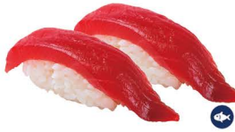
2. NIGIRI ATÚN 4,50€