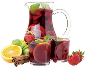
JARRA DE SANGRÍA 10,00€