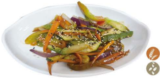
72. VERDURAS VARIADAS A LA PLANCHA 6,00€