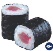
11. MAKI ATÚN 4,00€