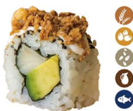
25. ROLL DE CEBOLLA FRITA (Pez mantequilla, aguacate mayonesa y cebolla frita) 6,00€