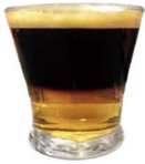
CAFÉ CARAJILLO 3,50€