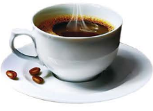
CAFÉ SOLO 2,00€