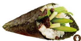
39. TEMAKI VEGETAL (Mixta pepino aguacate y trufa) 5,50€/ 1ud.