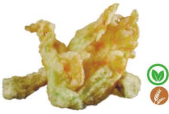
50. TEMPURA DE VERDURAS VARIADAS 6,50€