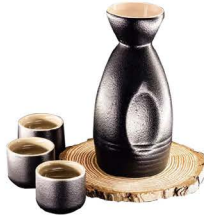
SAKE CALIENTE 7,00€