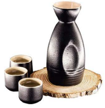
SAKE FRIO 7,00€