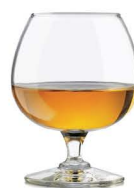
COPA DE LICOR 3,50€