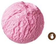
115. HELADO UNA BOLA (Choco, Vainilla, frambuesa, mango, sorbete limón) 2,50€