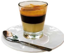
CAFÉ BOMBÓN 3,00€