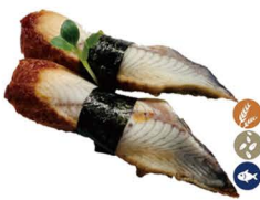
9. NIGIRI UNAGI (Anguila salsa teriyaki) 7,00€