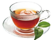
TÉ VERDE 2,20€