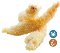
51. TEMPURA LANGOSTINO (3UDS.) 7,50€