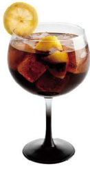
CUBATA COMBINADO ESPECIAL 8,50€