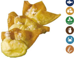
55. WANTUN DE QUESO (4 UDS.) (Crepes de harina de trigo rellenos de crema de queso y surimi) 5,50€