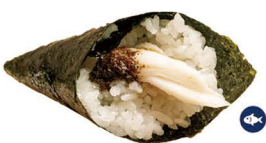
38. TEMAKI PEZ MANTEQUILLA (Pez mantequilla pepino, trufa) 5,50€/ 1ud.