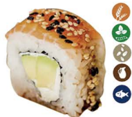
26. PHILADELPHIA ROLL (Roll de philadelphia con aguacate, cubierto de salmón, soja, alga nori y miel de sésamo) 6,00€