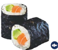
14. MAKI DE SALMÓN Y AGUACATE (Salmón y aguacate) 4,00€