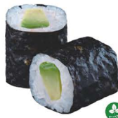
12. MAKI AGUACATE 3,50€