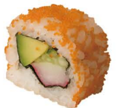
27. CALIFORNIA ROLL (Con aguacate, surimi, pepino, tobiko y alga nori) 6,00€