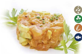
43. TARTAR DE SALMÓN (Con salmón, aguacate, cebollino y sésamo) 9,00€