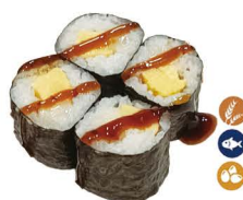
15. MAKI PEZ MANTEQUILLA CON TORTILLA HUEVO 3,50€