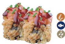
19. RHOT ROLL (Tartar de salmón philadelphia, surimi salsa teriyaki, sésamo, cebollín) 5,00€