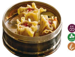
73. SHAO MAI CARNE (3 UDS.) 6,00€