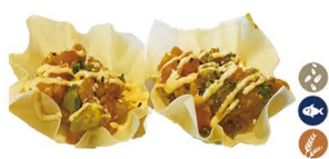
34. TACO DE SALMÓN 6,00€/ 2uds.