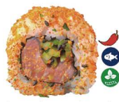
24. ROLL SPICY SALMÓN (Salmón, pepino, togarashi, huevas de tobiko, tabasco, mayonesa picante) 6,00€