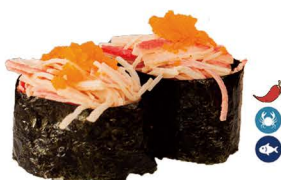
42. CANGREJO (Cangrejo, mayonesa picante y masago) 6,00€/ 2uds.