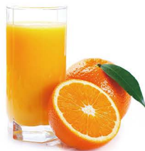
ZUMO NATURAL 3,60€