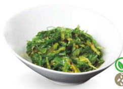
45. WAKAME 6,00€