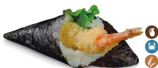
37. TEMAKI LANGOSTINO (Langostino en tempura ensalada, salsa rosa) 5,50€/ 1ud.